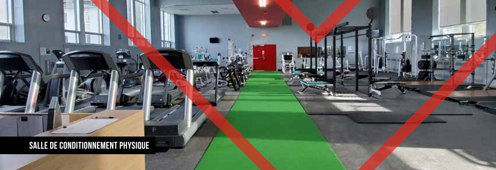
SALLE DE CONDITIONNEMENT PHYSIQUE

Depuis plus de 50 ans, nos étudiantes et étudiants-athlètes évoluent fièrement sous l'emblématique nom des Gaulois. Aujourd'hui, notre programme de sports d'excellence regroupe plus de 150 athlètes du Cégep de La Pocatière et de l'ITAQ, campus de La Pocatière, répartis dans sept disciplines. L'environnement dans lequel évoluent nos Gaulois favorise le développement tant comme étudiant-athlète que comme personne. Grâce à un cadre sain et respectueux, un encadrement sportif et académique professionnel ainsi qu'une grande attention accordée à la réussite scolaire, nos étudiants-athlètes ont tous les outils pour exceller tant sur le terrain qu'en classe.