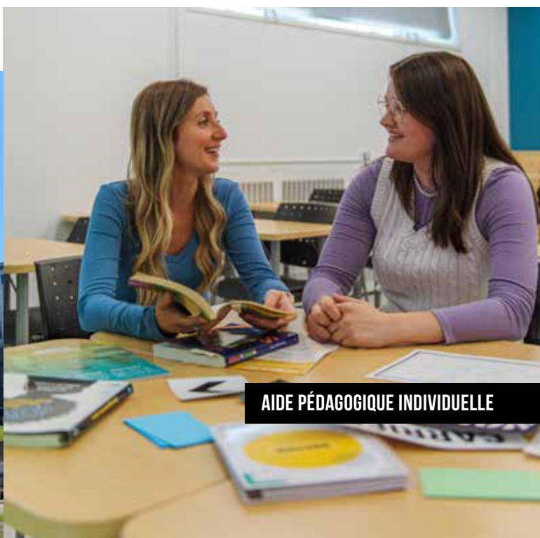
AIDE PÉDAGOGIQUE INDIVIDUELLE