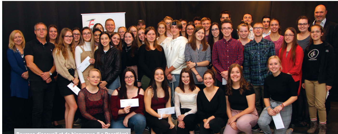
Bourses d'accueil et de bienvenue (La Pocatière)