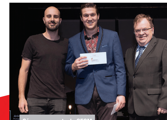
Cégep en spectacle CECM