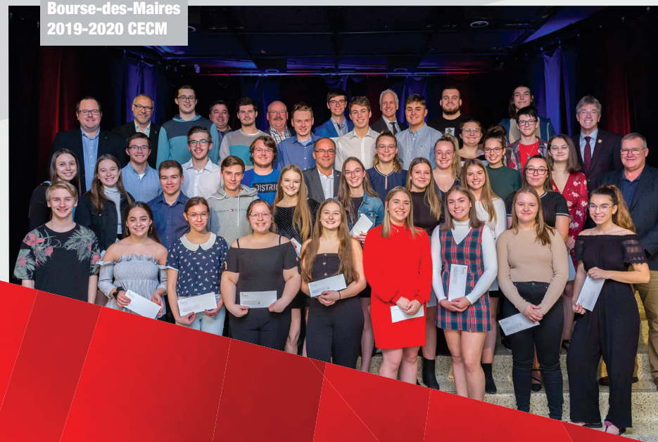
Bourse-des-Maires 2019-2020 CECM

Les membres du conseil d'administration et le personnel de la Fondation remercient tous les donateurs de la communauté collégiale, toutes les entreprises et organisations donatrices, ainsi que tous les bénévoles pour leur engagement et leur travail. Vous êtes importants pour nous, pour nos étudiants.