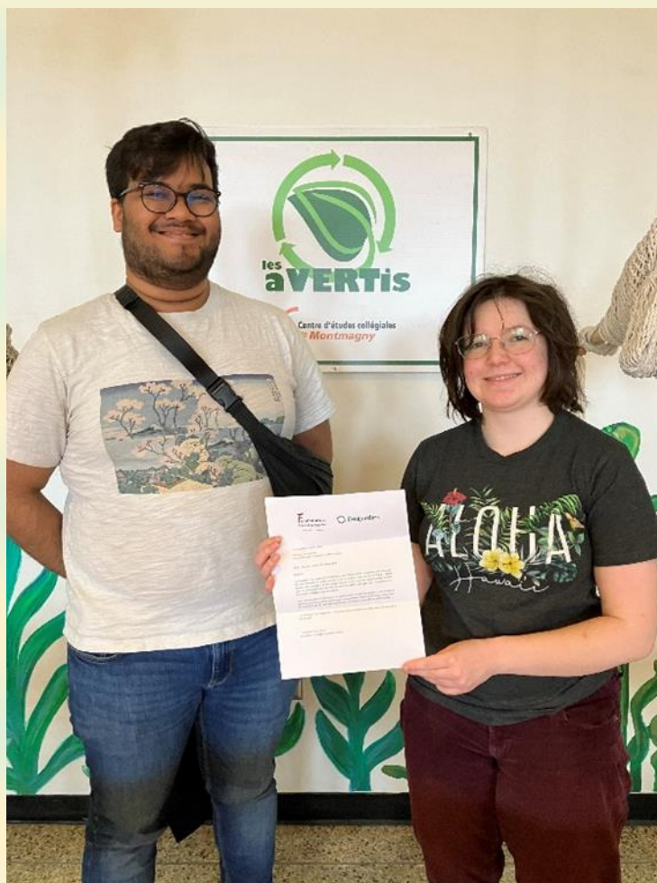
Comité Les Avertis