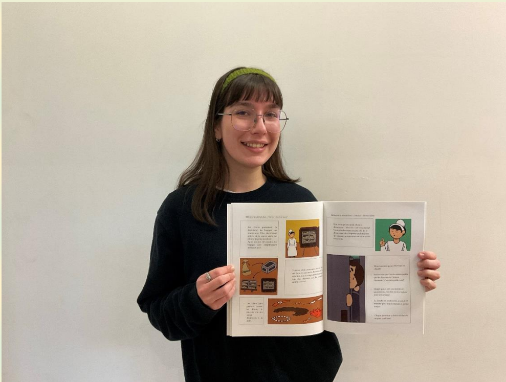
Projet Oscar à Grosse île

C'est avec beaucoup d'enthousiasme que la Fondation voit se concrétiser autant de projets variés qui permettent aux étudiants de se réaliser pleinement.