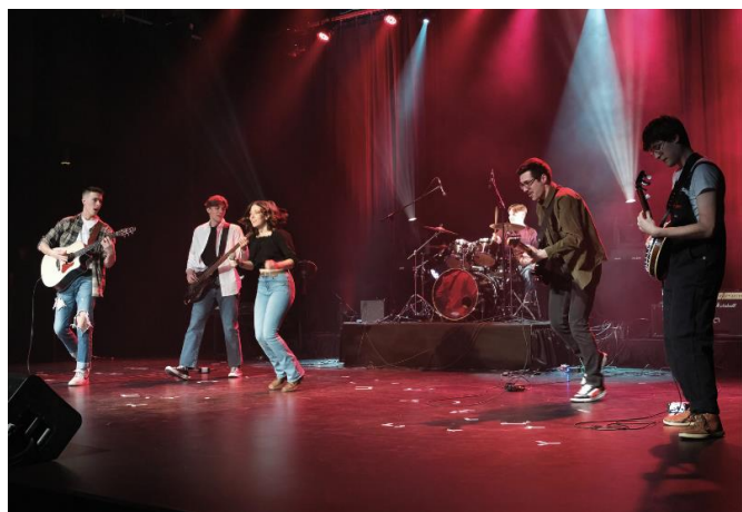
Le groupe St-Thomas en prestation