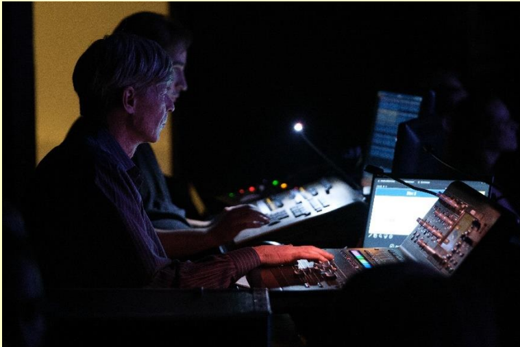
Les techniciens du son et de l'éclairage s'affairent à rendre le Gala spectaculaire.