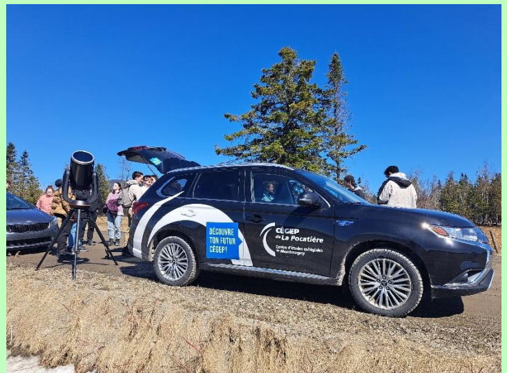
Observation de l'éclipse solaire le 8 avril 2024