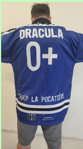
L'un des chandails de la ligue d'impro