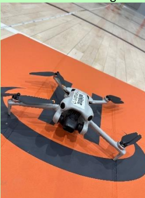
Formation en pilotage de drone