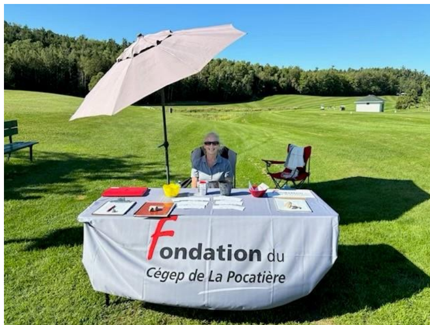
Club de golf de Saint-Pacôme

Elle a aussi participé du tournoi de golf de la Chambre de commerce de Kamouraska-L'Islet en y tenant un kiosque d'information le jeudi 29 août .