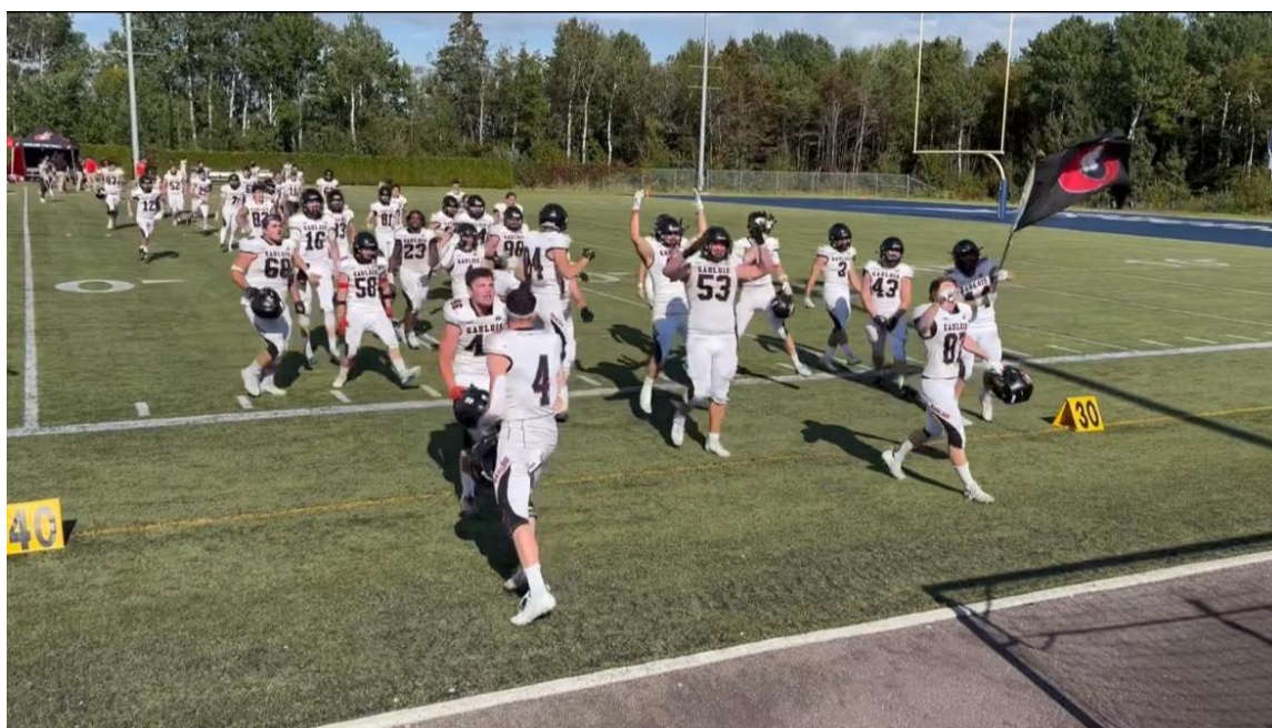
Les Gaulois victorieux 25-15 contre les Gaillards de Jonquière