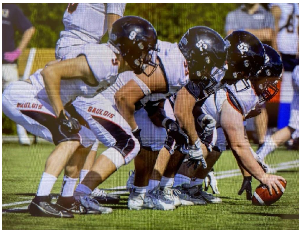
Les Gaulois en position offensive