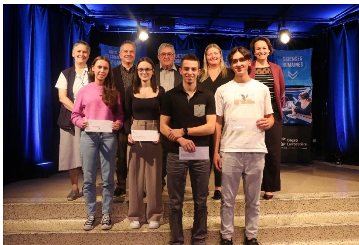
Remise des bourses de bienvenue au Campus de Montmagny

La Fondation du Cégep de La Pocatière félicite les nombreux lauréats de cette année et remercie du fond du cœur tous les donateurs qui, en l'appuyant financièrement, lui permettent de bien remplir sa mission.