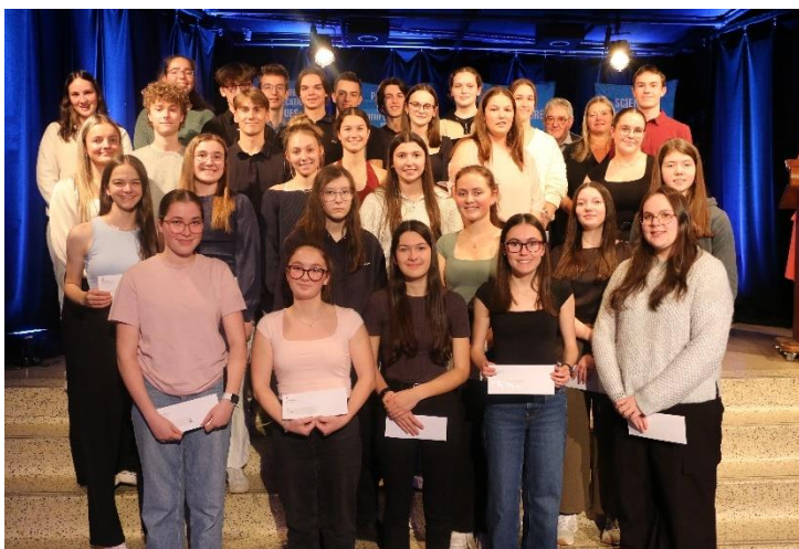
Remise des bourses en Sciences de la nature au Campus de Montmagny

Voici quelques photos de la remise de bourses qui a eu lieu le 22 octobre au Centre d'études collégiales de Montmagny.